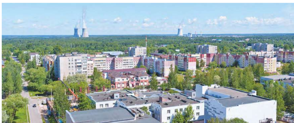
В Удомле в этом году на гранты «Росэнергоатома» и Фонда «АТР АЭС» будут реализованы инициативы патриотической направленности

составила общая сумма грантов на проекты от УГО с 2013 года