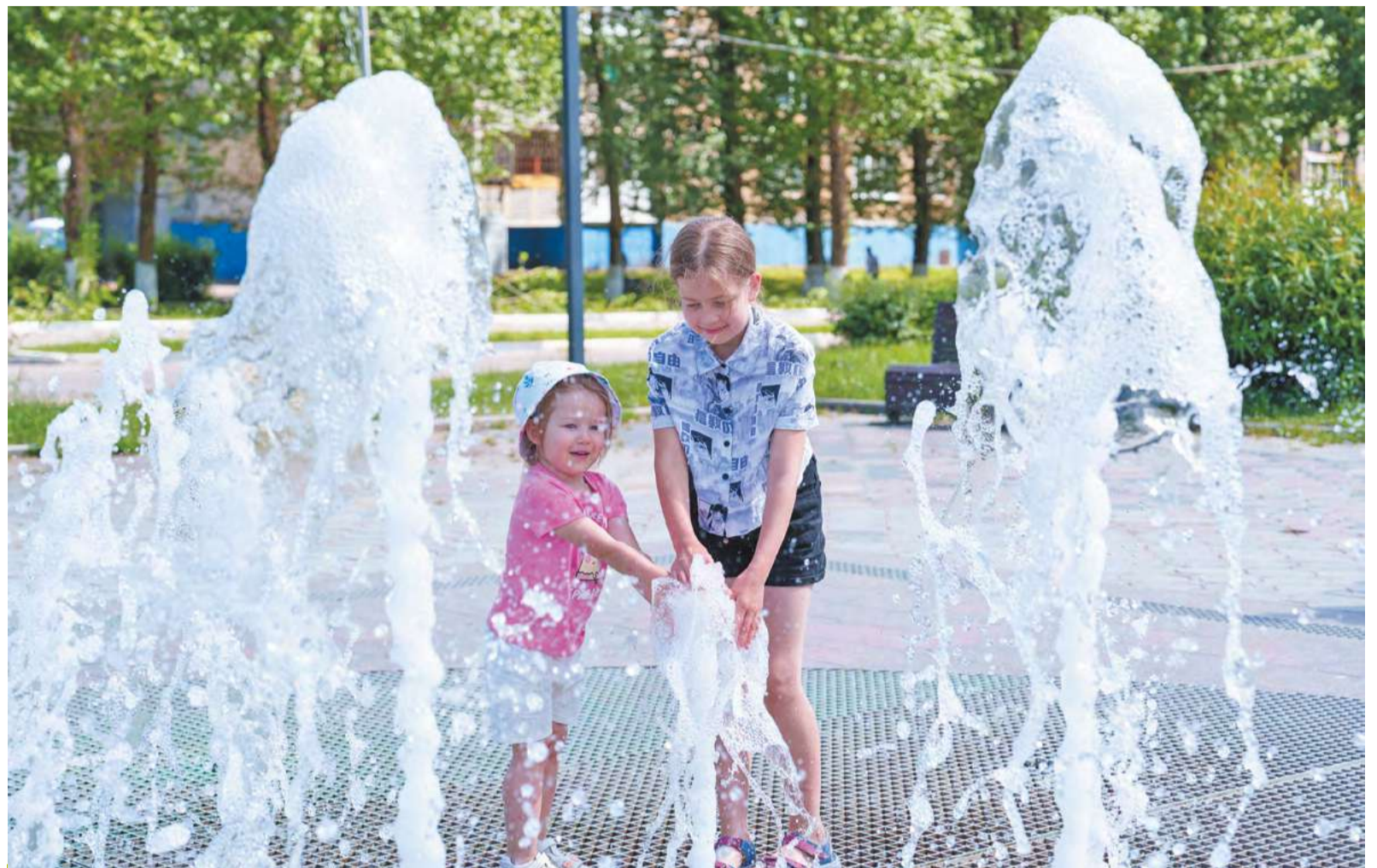
Фонтан на аллее по проспекту Энергетиков стал одной из достопримечательностей и излюбленным местом отдыха жителей и гостей города атомщиков