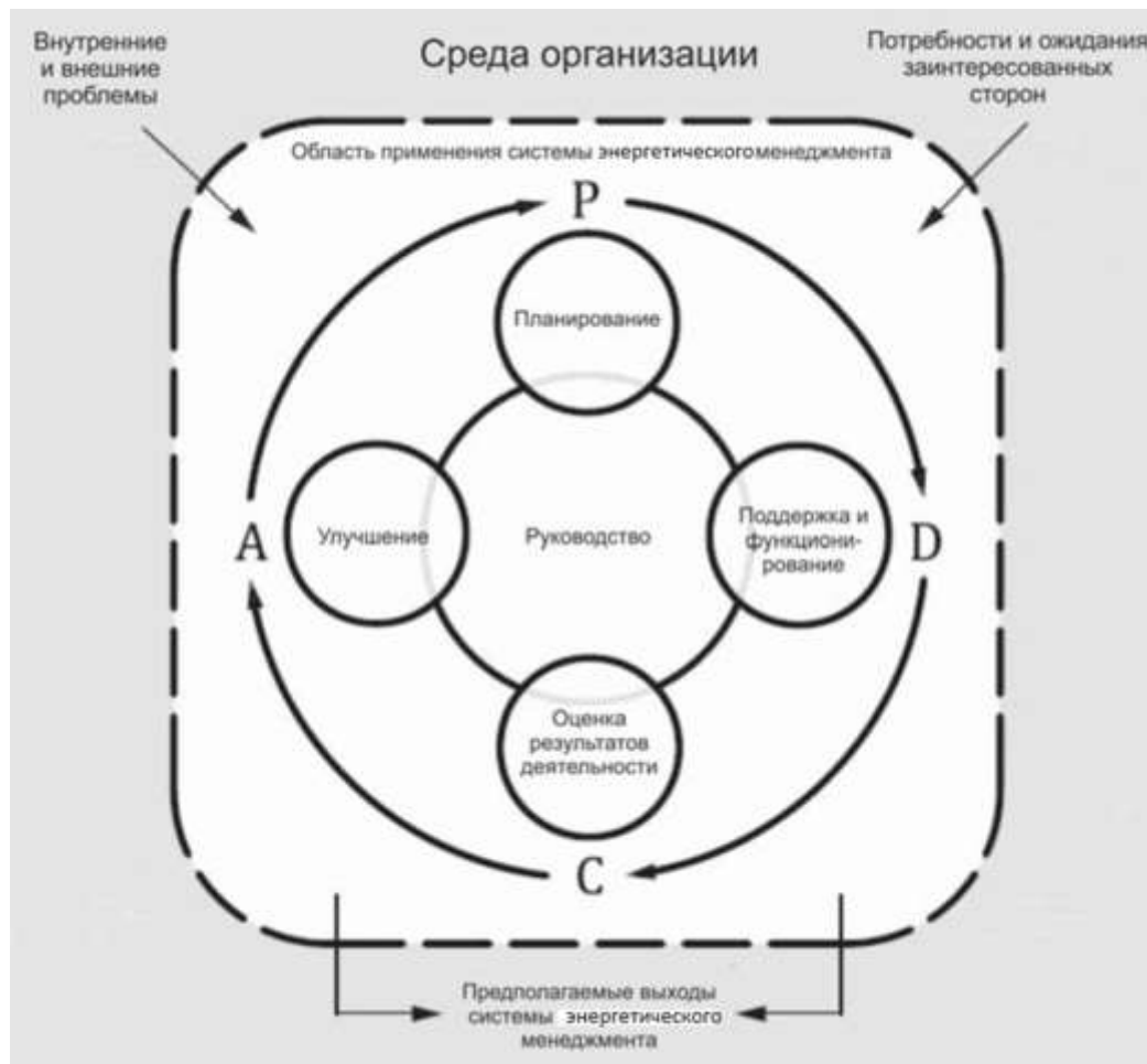
Рисунок 1 — Цикл «Планируй – Делай – Проверь – Действуй»