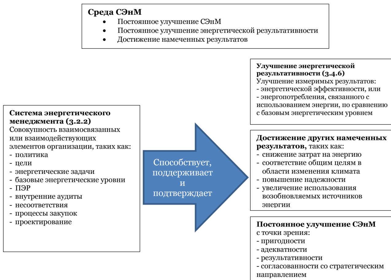
Рисунок А.1 — Взаимосвязь между энергетической результативностью и СЭнМ

Данный документ рассматривает улучшение энергетической результативности и подход системы менеджмента к управлению энергией. СЭнМ использует взаимосвязанные элементы, такие как показатели энергетической результативности (ПЭры) и базовые энергетические уровни (БЭУ) в качестве средства для демонстрации измеримых улучшений в энергоэффективности или энергопотреблении, связанных с использованием энергии (см. Рисунок А.1).