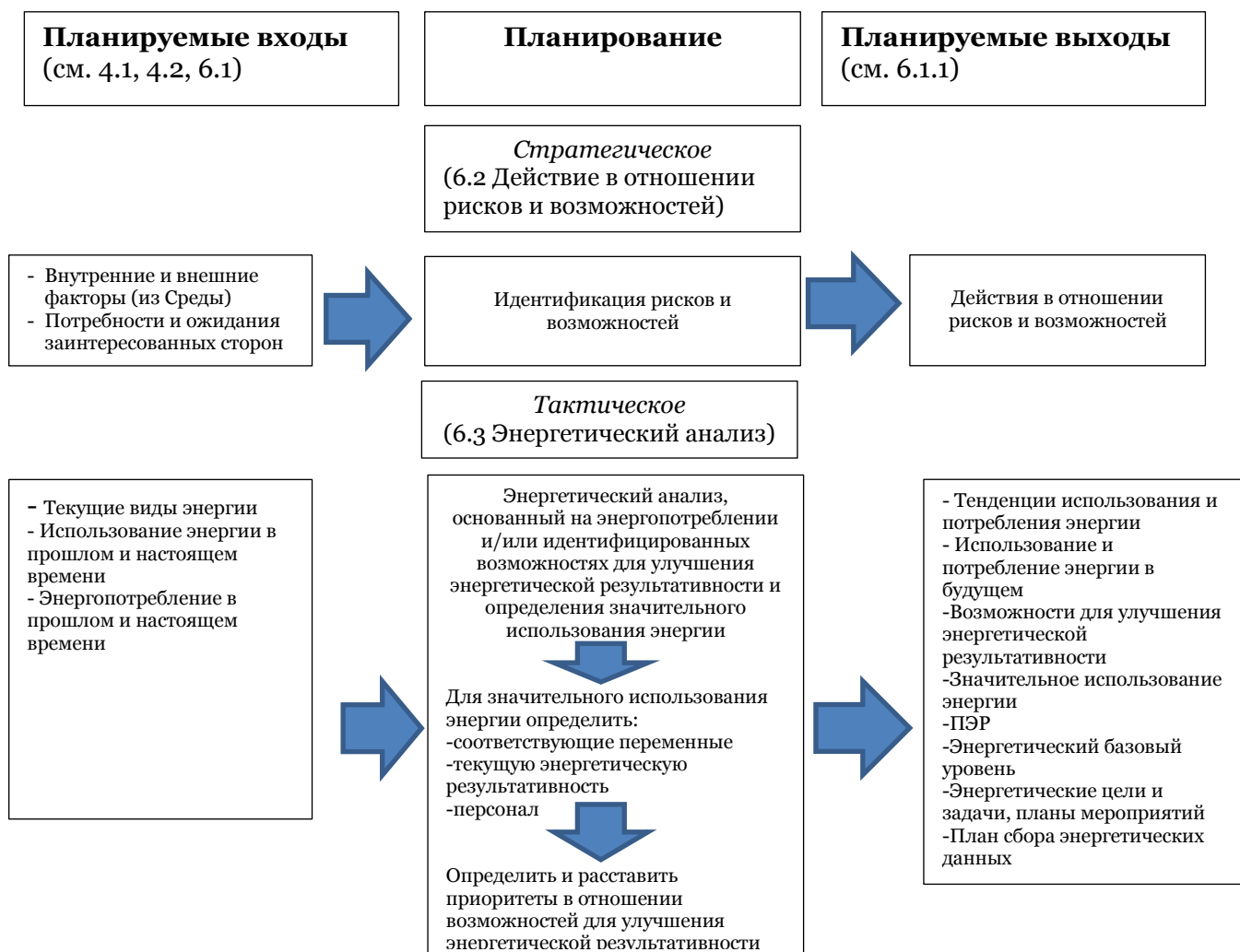
Рисунок А.2 — Процесс энергетического планирования

Рисунок А.2 не отражает подробностей конкретной организации. Информация на Рисунке А.2 носит иллюстративный характер, но не должна быть исчерпывающей, и могут существовать другие подробные сведения об организации или о конкретных обстоятельствах.